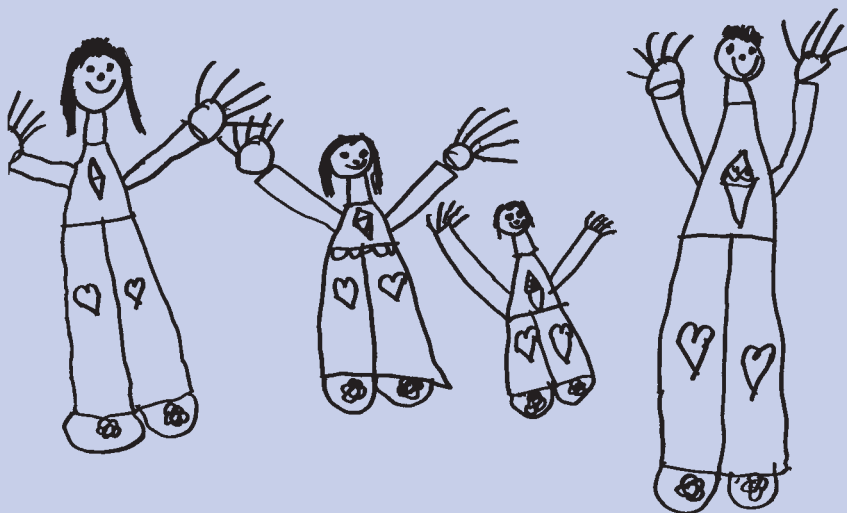
Miluška, 6 let