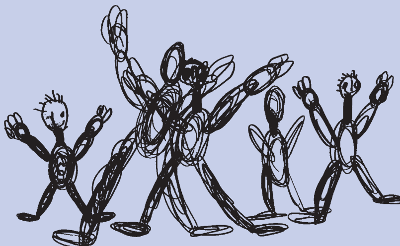
Martin Kaličiak, 5 let 1 měsíc

© PhDr. Ilona Špaňhelová, 2005 © Vzdělávací institut ochrany dětí, 2005