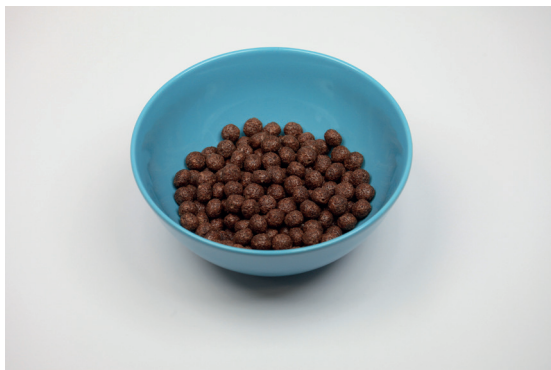
Doporučených 30 gramů

Problémem je i velikost porce. Ta, která nám připadá přiměřená, se velice liší od té doporučené výrobcem i odborníky (30 g).