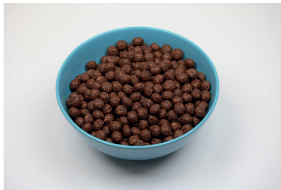
Reálně konzumovaná porce