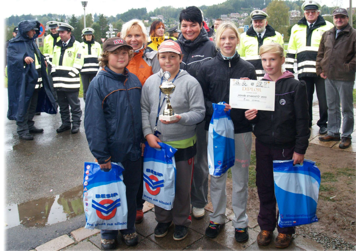
„POHÁR STAROSTKY MĚSTA HRONOVA“ 2010